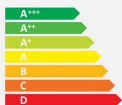
Old energy label